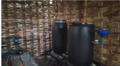
Gambar 4. Biodigester

Biodigester yang dibuat adalah biodigester yang tidak permanen ( portable ) yang dapat dipindah sesuai saran dari pemilik home industry tahu seperti Gambar 4.