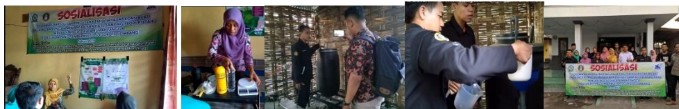
Gambar 5. Kegiatan penjelasan materi, demonstrasi membuat starter, demonstrasi biodigester, demonstrasi biogas

Kegiatan demonstrasi pembuatan biogas dilakukan setelah tim peneliti melakukan sosialisasi yang meliputi ceramah tentang limbah, bahaya limbah dan cara memanfaatkan limbah. Selanjutnya tim peneliti mendemonstrasikan cara membuat starter, mendemokan biogas dan terakhir mendemokan cara membuat biogas. Masing-masing kegiatan dapat dilihat pada Gambar 5.