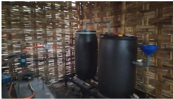
Gambar 4. Biodigester