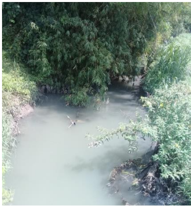
Gambar 1. Sungai yang terkena limbah cair tahu