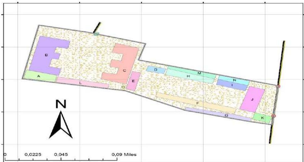
Gambar 2. Polygon oleh GPS Handheld