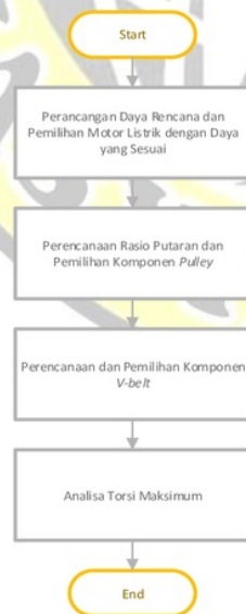
Gambar 1. Rancangan Penelitian

Gambar 1 dibawah ini menunjukkan diagram alir perancangan sistem penggerak trainer transmisi manual.