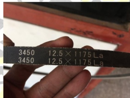
Gambar 4. V-belt 12,5 x 1175 La

Pemilihan panjang sabuk sesuai pasaran adalah 12,5 x 1175 La seperti terlihat pada gambar di bawah ini: