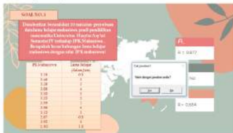
Gambar 3. Tampilan layar Microsoft Power Point Berbasis Macro Visual Basic

Tahapan ini dimulai dengan mengembangkan instrumen berupa soal-soal statistika berupa soal pilihan ganda yang berjumlah 5 soal dan dikemas dalam aplikasi microsoft power point berbasis Macro VBA.