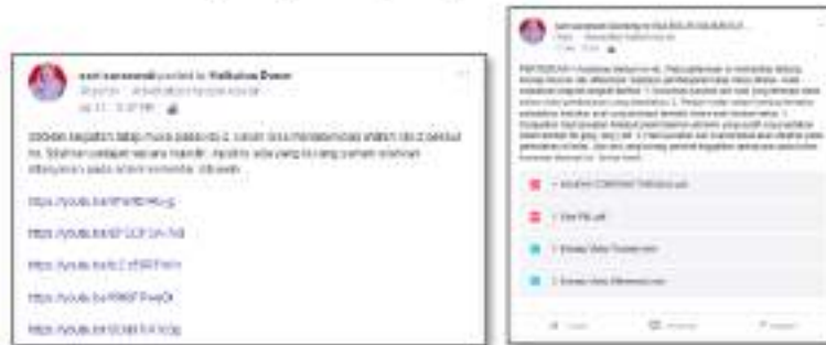
Gambar 2. Pemberian Bahan Ajar Online

Edmodo seperti facebook sehingga mudah digunakan. Berikut ini tampilan pemberian informasi kegiatan pembelajaran pada edmodo.