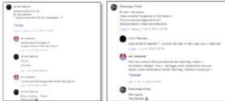
Gambar 4. Interaksi Dosen dan Mahasiswa

mahasiswa serta antar mahasiswa itu sendiri. Berikut ini hasil dokumentasi dari interaksi berikut yang terjadi dapat diperhatikan pada gambar 2 dan 3.