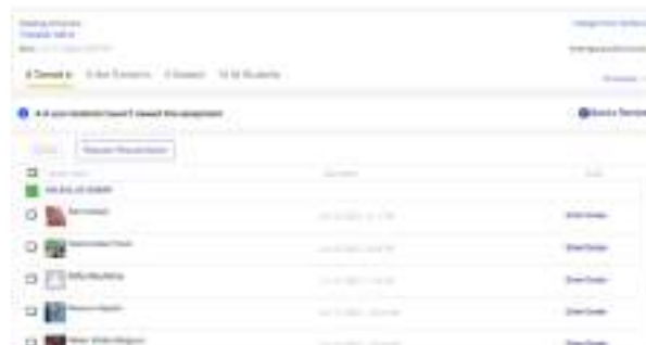
Gambar 3. Tampilan Pengumpulan Tugas Mahasiswa pada Edmodo

Selain pemberian bahan ajar berupa Power Point , video , dan handout , pada setiap akhir kegiatan pembelajaran, mahasiswa diberikan tugas berupa latihan soal terkait materi yang telah dipelajari secara tatap muka. Tugas dapat diakses melalui Edmodo sehingga mereka dapat memiliki waktu dan kesempatan lebih lama untuk menyelesaikannya. Berikut dapat dilihat pengumpulan tugas mahasiswa pada gambar 3 berikut.