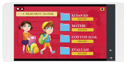
Gambar 2. Tampilan menu utama