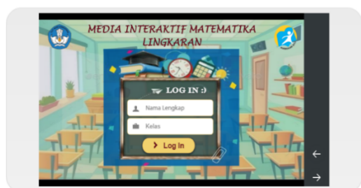
Gambar 1. Tampilan awal media

Pada tahap Design (perancangan) dilakukan pemilihan media, pemilihan format dan rancangan awal media. Pemilihan media dilakukan identifikasi media yang sesuai dengan analisis yang telah dilakukan pada tahap define dan juga komponen yang mendukung lainnya. Pada penelitian ini media yang digunakan adalah media pembelajaran interaktif menggunakan software Articulate Storyline yang dilengkapi dengan uraian materi, contoh soal, latihan soal dan game edukasi. Selanjutnya dilakukan perumusan format media, apa saja yang akan dicantumkan pada tiap konten utama tersebut, yang disesuaikan dengan materi yang digunakan dan komponen gambar dll, yang sudah dipilih pada tahap sebelumnya. Selanjutnya dilakukan perancangan awal media pembelajaran interaktif menggunakan software Articulate Storyline hingga diperoleh desain awal media. Untuk rancangan awal media pembelajaran interaktif menggunakan software Articulate Storyline yang dikembangkan disajikan pada Gambar 1, 2, 3, 4, 5, dan 6.