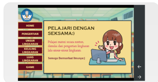
Gambar 3. tampilan menu materi