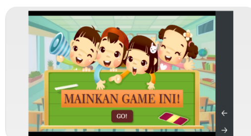
Gambar 6. Tampilan menu game

Hasil desain awal ini kemudian disempurnakan menjadi draf 1 media yang selanjutnya divalidasi oleh validator ahli pada tahap develop (pengembangan). Pada tahap ini dilakukan validasi media, uji keterbacaan dan ujicoba produk. Hasil validasi media ditunjukkan pada Tabel 1 berikut.