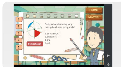
Gambar 4. Tampilan contoh soal