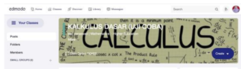
Gambar 2. Revisi tampilan kelas di edmodo

Berdasarkan hasil validasi semua pakar diperoleh bahwa produk yang dikembangkan dapat diterapkan dengan beberapa revisi. Sebelum mengikuti kegiatan belajar dengan blended learning , pada pertemuan sebelumnya, terlebih dahulu mahasiswa diberikan informasi terkait pengenalan platform yang digunakan, cara registrasi, informasi kode kelas, serta beberapa teknis yang berkaitan dengan penggunaan Edmodo. Revisi prototype 1 , pertama dengan menambahkan gambar pada tampilan kelas di Edmodo. Hal ini dapat dilihat pada gambar 2 berikut.