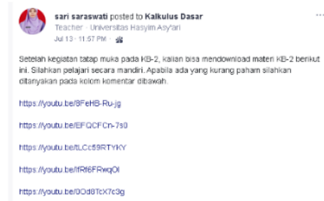
Gambar 3. Hasil revisi sumber belajar video dalam link youtube

Selanjutnya, revisi kedua dilakukan terkait postingan video pembelajaran yang dibagikan dalam bentuk link youtube . Melalui youtube , mahasiswa lebih mudah dalam mengakses video penjelasan materi dan mereka dapat mengulang-ulangnya sampai paham. Pada gambar 3 berikut adalah perbaikan postingan video yang disajikan dalam bentuk tautan.