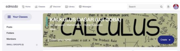
Gambar 2. Revisi tampilan kelas di edmodo

Berdasarkan hasil validasi semua pakar diperoleh bahwa produk yang dikembangkan dapat diterapkan dengan beberapa revisi. Sebelum mengikuti kegiatan belajar dengan blended learning , pada pertemuan sebelumnya, terlebih dahulu mahasiswa diberikan informasi terkait pengenalan platform yang digunakan, cara registrasi, informasi kode kelas, serta beberapa teknis yang berkaitan dengan penggunaan Edmodo. Revisi prototype 1 , pertama dengan menambahkan gambar pada tampilan kelas di Edmodo. Hal ini dapat dilihat pada gambar 2 berikut.