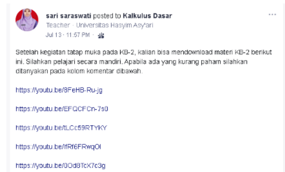
Gambar 3. Hasil revisi sumber belajar video dalam link youtube

Selanjutnya, revisi kedua dilakukan terkait postingan video pembelajaran yang dibagikan dalam bentuk link youtube . Melalui youtube , mahasiswa lebih mudah dalam mengakses video penjelasan materi dan mereka dapat mengulang-ulangnya sampai paham. Pada gambar 3 berikut adalah perbaikan postingan video yang disajikan dalam bentuk tautan.