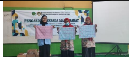
Gambar 17: Peserta Menyajikan Hasil Karya