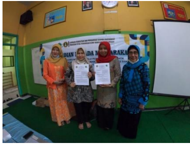
Gambar 1: penandatanganan MOU