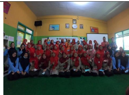
Gambar 18: Peserta Menyajikan Hasil Karya