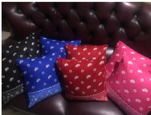
Gambar 3: Contoh motif jumputan sebagai materi pelatihan

Motif batik tersebut diatas dapat dijadikan asesoris interior berbagai jenis barang, seperti cushion cover (sarung bantal), tas belanja, penutup meja, gorden, taplak meja yang di latih pada kesempatan pengabdian masyarakat ini.