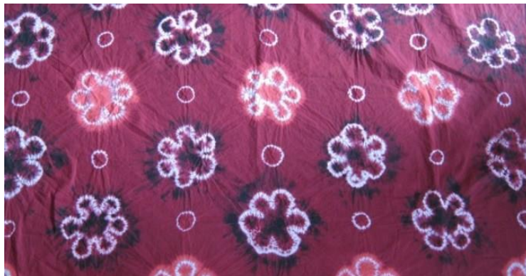
Gambar 1: Contoh motif jumputan sebagai materi pelatihan

Membatik jumputan yang diberikan dapat untuk meningkatkan kemampuan motoric halus siswa karena anak dapat bermain warna sekaligus mengkoordinasikan gerakan mata dan jari tangannya dalam menjumput atau mengikat kain sehingga membentuk motif batik jumputan tertentu. Bagi anak proses membatik jumputan sendiri merupakan suatu kegiatan pembuatan kerajinan tangan yang menarik dimana anak dapat mengenal kesenian batik.