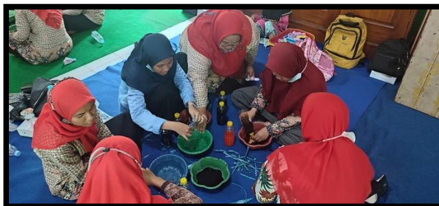
Gambar 7: Proses Pewarnaan Kain yang telah Selesai Diikat