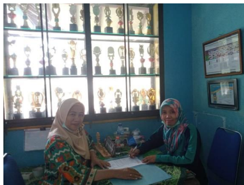
Gambar 2: Survey awal dan pengajuan izin di lokasi PKM

Menurut survey awal yang dilakukan peneliti, guru-guru di TK Roudlotul Hikmah Jombang belum mendapatkan pembelajaran praktek membuat batik jumputan, mereka hanya dibekali pengetahuan membatik dengan teknik yang lain selain motif jumputan. Pemilihan sekolah TK Roudlotul Hikmah Jombang dijadikan sebagai mitra didasarkan pula karena sekolah ini memiliki program sentra yang terpadu salah satunya adalah sentra seni. Oleh karena itu, dipandang perlu diadakan pelatihan agar SDM lebih terlatih dan nantinya dapat memunculkan kreativitas siswa serta mempunyai wawasan lebih dan mengerti akan hasil suatu produk akan dapat berdaya guna. Tentunya dengan pelaksanaan pelatihan ini diharapkan mampu menghasilkan variasi pembelajaran seni dengan melihat issue trend yang berkembang di masyarakat serta kontekstual dalam artian dapat disesuaikan dengan kondisi siswa sehari-hari.