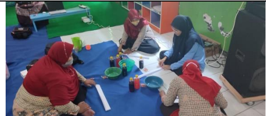
Gambar 7: Tim PKm dari Mahasiswa Mempraktikkan Cara Pembuatan Batik