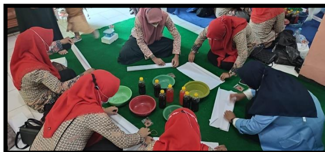
Gambar 5: Proses Pembuatan Pola Jumputan di Kain dengan Melipat Kain dan Mengikat