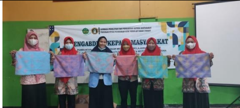
Gambar 10: Peserta Menyajikan Hasil Karya