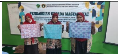
Gambar 13: Peserta Menyajikan Hasil Karya