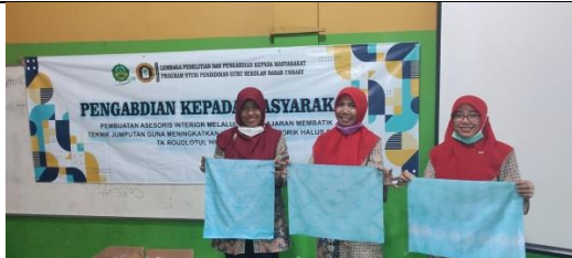
Gambar 11: Peserta Menyajikan Hasil Karya