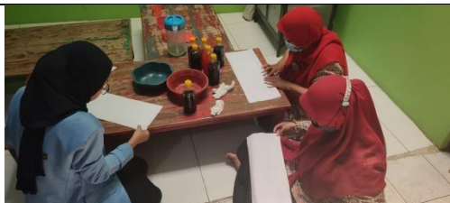
Gambar 4: Tim PKm dari Mahasiswa Mempraktikkan Cara Pembuatan Batik