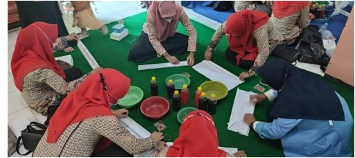
Gambar 5: Tim PKm dari Mahasiswa Mempraktikkan Cara Pembuatan Batik