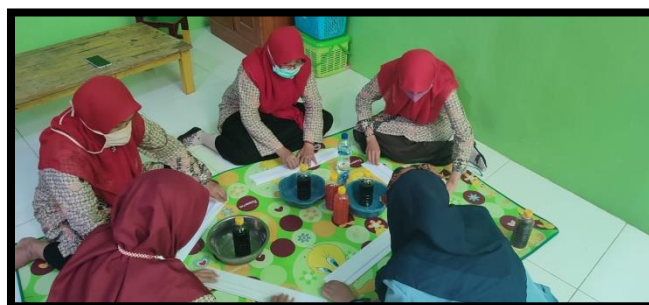
Gambar 6: Proses Pendampingan oleh Mahasiswa