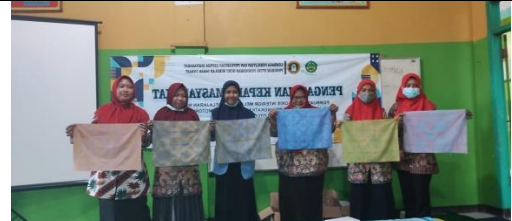
Gambar 15: Peserta Menyajikan Hasil Karya