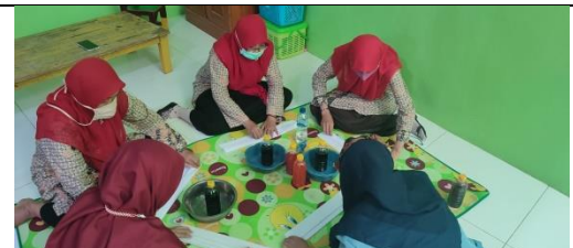
Gambar 8: Peserta mencoba mempraktikkan secara mandiri proses pelipatan kain