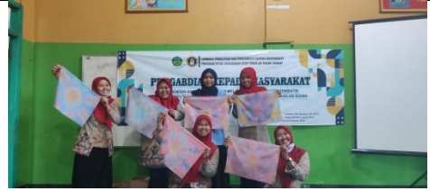
Gambar 14: Peserta Menyajikan Hasil Karya