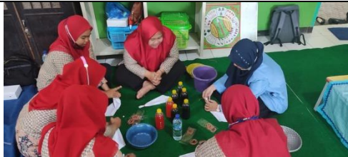
Gambar 3: Tim PKm dari Mahasiswa Mempraktikkan Cara Pembuatan Batik