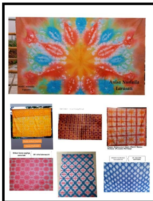
Gambar 4: Motif yang Dibuat oleh Peserta