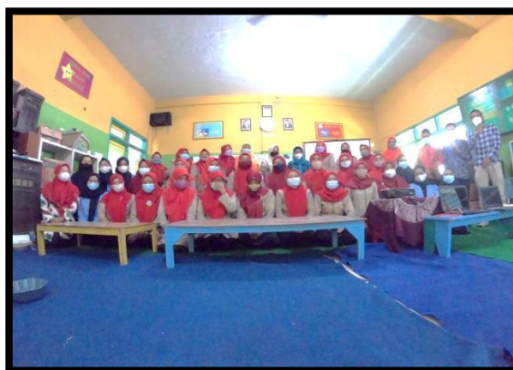
Gambar 10: Sesi Penutup dalam Bentuk Dokumentasi Tim Pelaksana dan Peserta Pelatihan

Pelatihan ini ada beberapa tahap yang dilaksanakan yaitu pemaparan materi, praktek mandiri yang meliputi: mendesain pola jumputan, melipat, mengikat, pewarnaan dan penjemuran kain. Secara keseluruhan pelaksanaan pelatihan ini berjalan dengan lancar dan menghasilkan produk kreatif. Kegiatan pelatihan ini tidak akan berjalan secara maksimal tanpa persiapan yang cukup dan kerjasama antara pelaksana dan peserta.