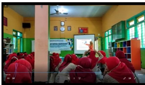
Gambar 3: Pemaparan Materi Teknik Jumputan

Langkah 1 : Peserta latihan diberikan materi mengenai pentingnya pendidikan seni terhadap pembelajaran di pendidikan dasar