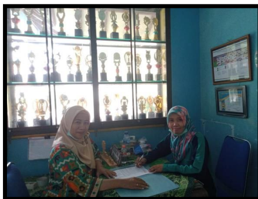
Gambar 1: Observasi Awal untuk Mengetahui Situasi Mitra

membatik dengan teknik yang lain selain motif jumptan. Pemilihan sekolah TK Roudlotul Hikmah Jombang dijadikan sebagai mitra didasarkan pula karena sekolah ini memiliki program sentra yang terpadu salah satunya adalah sentra seni. Oleh karena itu, dipandang perlu diadakan pelatihan agar SDM lebih terlatih dan nantinya dapat memunculkan kreativitas siswa serta mempunyai wawasan lebih dan mengerti akan hasil suatu produk akan dapat berdaya guna.