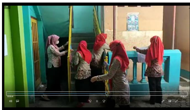
Gambar 8: Proses Penjemuran Kain

Langkah 5 : Pelatih meminta untuk mempresentasikan hasil karya yang telah dipelajari.