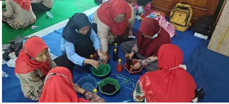
Gambar 9: Peserta mencoba mempraktikkan proses pewarnaan secara mandiri