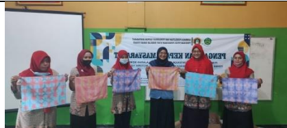
Gambar 12: Peserta Menyajikan Hasil Karya