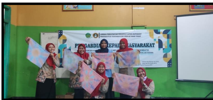
Gambar 9: Peserta Menyajikan Karya

Langkah 5 : Pelatih meminta untuk mempresentasikan hasil karya yang telah dipelajari.