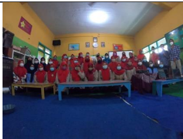
Gambar 2: Dokumentasi tim PKM dan Peserta Pelatihan