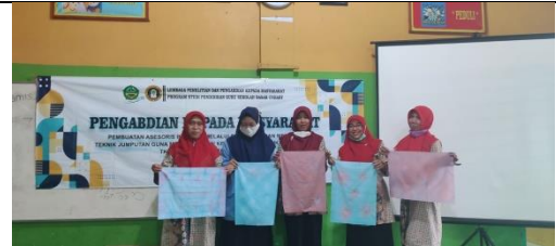
Gambar 16: Peserta Menyajikan Hasil Karya