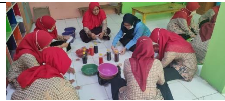
Gambar 6: Tim PKm dari Mahasiswa Mempraktikkan Cara Pembuatan Batik