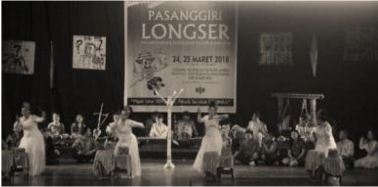
Ilustrasi Longser