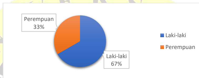
Gambar 1. Analisis Berdasarkan Jenis Kelamin

Penyebaran kuesioner dilakukan menggunakan kuesioner online pada Google Form dan disebarikan melalui WhatsApp. Responden yang didapatkan berdasarkan penyebaran kuesioner yaitu sebanyak 30 responden dan berasal dari mahasiswa semester 5 program studi S1 Teknik Informatika. Dalam penelitian ini, detail responden yang diperoleh dibedakan berdasarkan jenis kelamin dan usia.