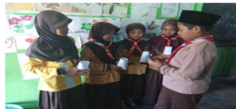
Gambar 2. Siswa membagi permen dan coklat kepada 4 orang siswa

Selanjutnya siswa tadi mulai membagikan permen dan coklat kepada masing-masing temannya tersebut dan memasukkannya ke dalam kantong ajaib yang dimiliki oleh keempat temannya. Hal ini dapat dilihat pada gambar 2 berikut