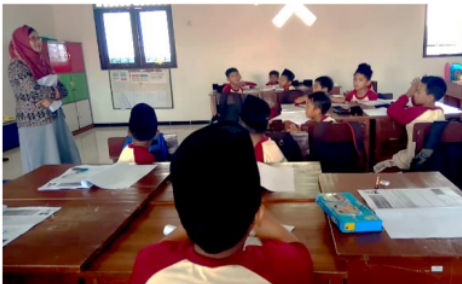
Gambar 1. Siswa melakukan permainan Joyful Number Clap (JNC)

Pembelajaran experiential learning yang diterapkan mengaitkan antara materi KPK dengan permainan Joyful Number Clap (JNC) . Dalam permainan ini siswa dibagi menjadi dua kelompok dimana kelompok yang satu harus bertepuk tangan saat guru menyebutkan kelipatan angka 2, sedangkan kelompok yang lain bertepuk tangan saat guru menyebutkan kelipatan angka 3. Para siswa yang terlibat dalam permainan ini sangat antusias. Mereka semua tertarik untuk mempraktekkan permainan ini. Hal ini dapat dilihat dari gambar 1 berikut.