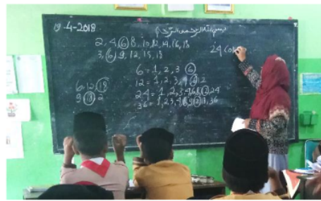
Gambar 3. Guru menulis hasil kelipatan 2 dan 3

Pada tahap ini, guru menjelaskan secara langsung konsep KPK dan FPB di depan kelas, sedangkan para siswa memperhatikan. Hal ini diawali dengan meminta siswa menyebutkan kelipatan 2 dan 3, selanjutnya guru menuliskan jawabannya di papan tulis. Hal ini dapat dilihat pada gambar 3 berikut.