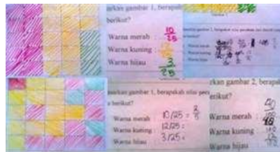
Gambar 5. Hasil arsiran siswa

Kesulitan yang lain ditemukan pada saat siswa mempresentasikan gambar yang sudah mereka arsir menjadi bentuk pecahan biasa. Namun setelah guru memberikan arahan, siswa dapat menyatakannya dalam bentuk pecahan \frac{10}{25} , \frac{12}{25} dan \frac{3}{25} sesuai dengan masing-masing warna arsiran seperti gambar 4 berikut. Karakteristik use of model ditunjukkan pada saat siswa dapat menyatakan banyaknya kotak yang diarsir pada gambar sesuai dengan perolehan suara pada pemilihan ketua kelas.