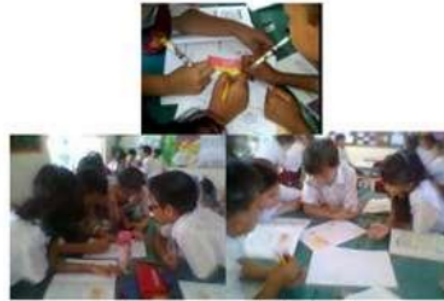
Gambar 4. Interactivity Selama Proses Pembelajaran

kotak di LKPD sehingga mereka kesulitan dalam mengitung banyak kotak yang harus diarsir pada area berpetak ukuran 10 \times 10 kotak. Siswa mendiskusikan kembali kesalahan tersebut dengan kelompoknya sehingga muncul interaksi dan komunikasi yang baik antar kelompok yang menunjukkan bahwa terdapat interactivity dalam proses pembelajaran.