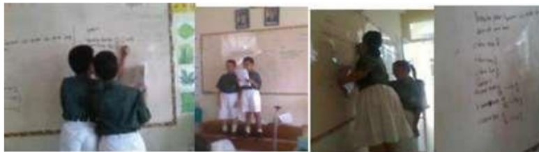
Gambar 8. Siswa Melakukan Presentasi Hasil Diskusi Kelompok

Di akhir aktivitas ini, siswa sudah mampu menyimpulkan cara mengubah pecahan biasa menjadi bentuk persen, namun mereka mengalami kesulitan dalam menguraikan penjelasannya secara formal. Selain itu, sebagian besar dari siswa dapat menyebutkan contoh persen dalam kehidupan sehari-hari saat diskusi dan presentasi hasil diskusi di depan kelas yang dilihat pada gambar 8.