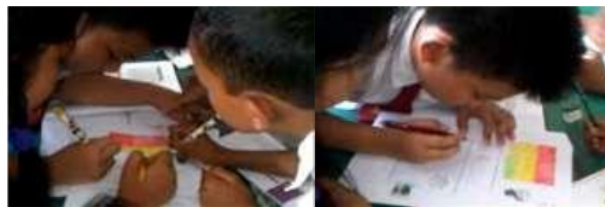
Gambar 3. Siswa Mengarsir Area Berpetak

Dalam menyelesaikan permasalahan yang ada di LKPD, siswa dibentuk kelompok yang terdiri dari 5 kelompok dimana masing-masing kelompok terdiri dari 5 siswa. Guru membagikan LKPD kepada masing-masing kelompok, dilanjutkan dengan menjelaskan tentang kegiatan siswa di LKPD. Setelah siswa menuliskan nama anggota kelompok, guru menjelaskan petunjuk pengerjaan LKPD yang ada pada aktivitas 1. Hal ini bertujuan agar siswa mampu mengarsir gambar kotak yang ada di LKPD sesuai dengan data yang sudah diperoleh pada pemilihan ketua kelas sebelumnya.