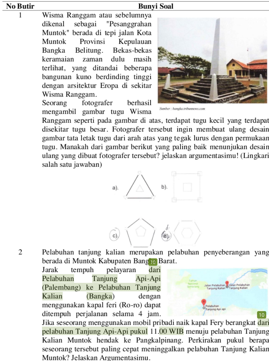
Tabel 3. Soal literasi matematika

penalaran matematika siswa dalam menyelesaikan soal literasi matematika. Contoh soal literasi matematika dapat dilihat pada Tabel 3.