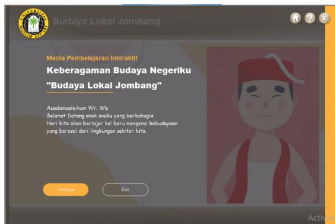
Gambar 1. Storyboard slide 2 media dengan bantuan lectora inspire