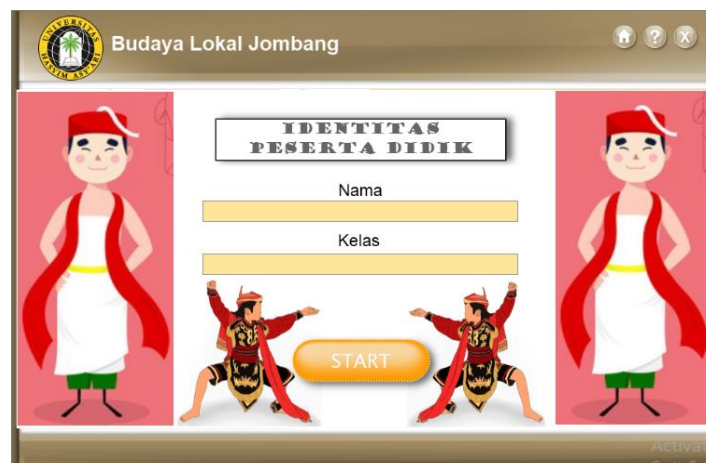
Gambar 1. Storyboard slide 1 media dengan bantuan lectora inspire