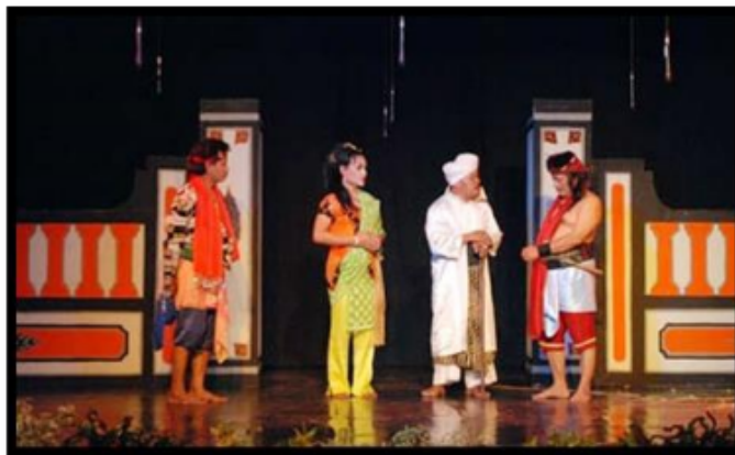
Gambar 2.2. Lakon Ludruk Budhi Wijaya yang mengangkat cerita Sunan Kalijaga

Kesenian ludruk Jombang berawal dari kesenian Lerok dan kemudian kesenian Besutan. Beriringan dengan perkembangan masyarakat, Kesenian kemudian berkembang menjadi kesenian yang