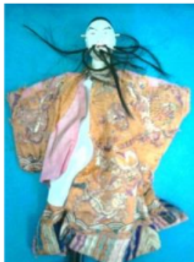
Gambar 2.7. Boneka Potehi yang berusia lebih dari seratus tahun

Upaya reproduksi terutama dengan memperhatikan kembali bentuk-bentuk boneka Potehi yang dibawa kakek Toni langsung dari Cina. Boneka tersebut diyakini telah berusia lebih dari 100 tahun dan merupakan boneka tertua yang ditemukan di Indonesia. Selain itu Toni juga melakukan observasi ke Semarang dan ke Hotel Tugu, Malang. Bahkan dia mendatangkan boneka Potehi dari Cina. Itu semua dilakukan demi mendapatkan bentuk ukiran serta karakter tokoh, pewarnaan yang pas.