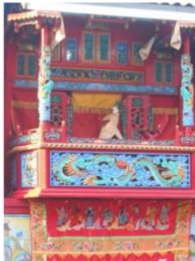
Gambar 2.6. Pertunjukan Potehi dengan lakon Kwee Coe Gie di kelenteng Gudo

Pada tanggal 23 April 2012 di halaman kelenteng Hong Sang Kiong Gudo, sebuah pertunjukan wayang Potehi. Menurut Sesomo, sang sehu (dalang) lakon ketika itu menceritakan tentang seorang pejuang bernama Kwee Coe Gie, yang hidup pada dinasti Tong di masa kaisar ke-5, sekitar awal abad ke-8.