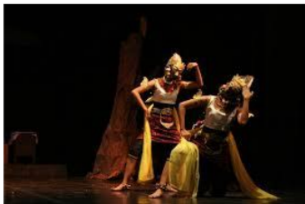
Gambar 2.8. Revitalisasi Tari Klana

kepemilikannya. Pernah berada di daerah trowulan, pernah juga berada di daerah Betek Mojoagung dan terakhir kini berada di Ds. Jatiduwur Kec. Kesamben Kab. Jombang.