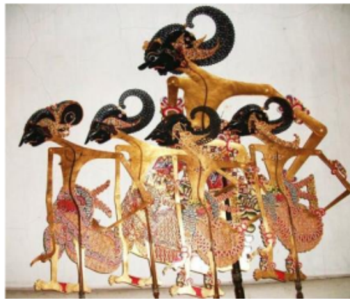
Gambar 2.4. Pandhawa sebagai tokoh sentral dalam pewayangan

Pertunjukan wayang diiringi dengan alat musik 37 yang disebut dengan Gamelan . Cerita pertunjukan wayang adalah cerita Ramayana dan Mahabharata . Cerita Wayang yang tertua terdapat buku Arjunawiwaha karangan Mpu Kanwa. Dalam perkembangannya cerita wayang tidak hanya dimainkan dalam bentuk wayang kulit tetapi kemudian dimainkan dalam bentuk tari atau wayang orang.