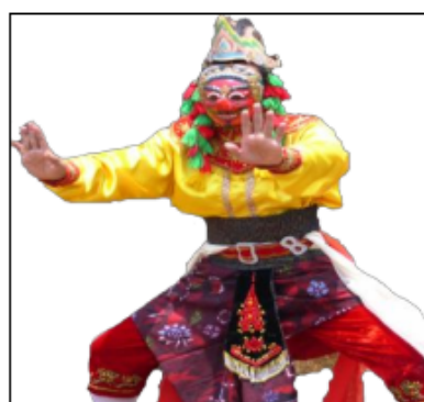
Gambar 2.3. Salah satu karakter dalam Topeng Sandur Manduro

yang bersembunyi di daerah perbukitan yang kala itu masih berupa hutan. Masyarakat Manduro sebagai keturunan orang Madura dalam kehidupan sehari-hari menggunakan bahasa Madura sebagai alat komunikasi meskipun mengerti 114 dan bisa berbahasa Jawa. Mayoritas penduduk desa manduro pemeluk agama Islam namun dalam kehidupan sehari-hari tetap melestarikan adat budaya tradisi lokal yang kental dengan nuansa Mataram atau kejawen seperti ritual yang berkaitan dengan inisiasi (daur hidup: yaitu upacara kelahiran dan kematian), ritual berkaitan dengan pertanian, ritual bersih desa, dan ritual nadzaran atau ruwatan atau harapan-harapan dalam kehidupan. Semua adat ritual tersebut dalam pelaksanaannya senantiasa disertai pertunjukan kesenian khas desa Manduro yang disebut topeng Sandur.