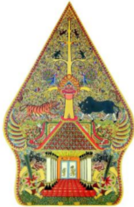
Gambar 2.5. Kayon Gaya Jawa Tengahan

Dalam pagelaran wayang kulit istilah penggarapan dialog atau tutur kata disebut dengan nama pocapan, janturan, gunem/ginem, berpegang pada bahasa Jawa pada umumnya, hanya saja pengucapan dialeknya berbeda satu sama lain. Apalagi kalau ditinjau dari segi budaya campuran yang ada di Jombang, menunjukkan bahwa bahasa yang dipakai adalah bahasa Jawa standar, yaitu bahasa Jawa etnis Surakarta atau Yogyakarta. Perbedaan penggunaan bahasa pada pertunjukan Wayang akan terlihat jelas dan kita jumpai pada dialek yang digunakan para Dalang sewaktu pentas, terutama Gaya Surakarta dan Gaya Cek-Dong di Jombang.