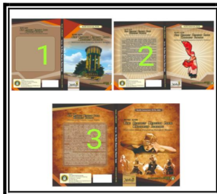
Gambar 2: Cover dari Buku Ajar Seni yang sudah melalui Tahapan Revisi

Hasil uji coba ini menunjukkan total skor adalah 1180 dari total skor adalah 1408. Setelah dianalisis dan dipresentasikan, nilai tersebut mendapatkan hasil sebesar 83.8 %. Dapat disimpulkan bahwa data uji coba menunjukkan hasil yang tinggi/signifikan meskipun masih terdapat beberapa kekurangan yang masih perlu dilakukan perbaikan selanjutnya.