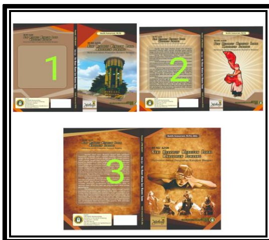
Gambar 2: Cover dari Buku Ajar Seni yang sudah melalui Tahapan Revisi

Hasil uji coba ini menunjukkan total skor adalah 1180 dari total skor adalah 1408. Setelah dianalisis dan dipresentasikan, nilai tersebut mendapatkan hasil sebesar 83.8 %. Dapat disimpulkan bahwa data uji coba menunjukkan hasil yang tinggi/signifikan meskipun masih terdapat beberapa kekurangan yang masih perlu dilakukan perbaikan selanjutnya.