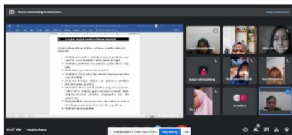
Gambar 2 Pelaksanaan perkuliahan

Pengujian dalam penerapan buku ajar perkuliahan metodologi penelitian dilaksanakan pada tanggal 13 September 2021, pengujian dilaksanakan dalam bentuk demonstrasi dan tanya jawab serta pemberian angket dengan durasi waktu 100 menit. Pengujian di lapangan ini dilakukan guna mengetahui respon mahasiswa terhadap produk buku ajar yang dikembangkan. Efektifitas di dapat dari respon mahasiswa tersebut dalam menanggapi produk buku ajar. Secara umum aspek yang diberikan berupa pemahaman mahasiswa dan minat mahasiswa. Terkait dengan indikator pada pencapaian keefektifan buku ajar metodologi penelitian, mahasiswa juga diberikan contoh gambaran soal. Melalui soal evaluasi di setiap bab memungkinkan mahasiswa untuk merefleksi kembali materi yang sudah dipelajari dan menjadikan mahasiswa untuk termotivasi belajar, hal ini dikarenakan mahasiswa dapat mengetahui kemampuan yang mereka miliki terkait dengan materi perkuliahan yang dibahas pada pertemuan tersebut. Selanjutnya berhubungan dengan minat siswa dalam penggunaan buku ajar menunjukkan efektifitas yang sangat baik. Pelaksanaan perkuliahan dan hasil tersebut dapat dilihat dalam gambar 2 dan 3 serta tabel 1 berikut.