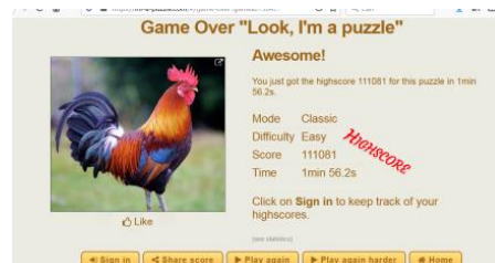
Gambar 7. skor yang diperoleh