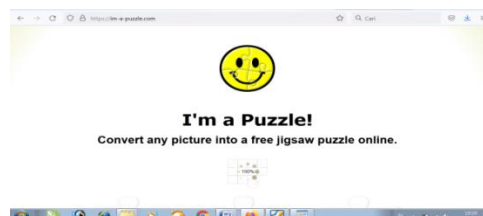
Gambar 2. Media Puzzle setelah dikembangkan

Media puzzle ini disesuaikan dengan kurikulum 2013 yang berlaku. Rancangan awal dalam membuat Media puzzle yaitu membuat akun, kemudian disesuaikan dengan kebutuhan siswa.