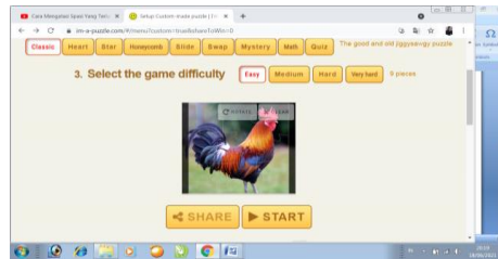
Gambar 3. Tampilan awal puzzle

Berdasarkan gambar 1.3 tampilan awal Media puzzle memuat tombol start dan share. Jika tombol start di klik, pemain akan diarahkan pada potongan-potongan puzzle .