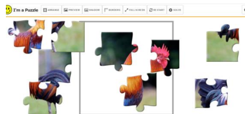
Gambar 5. Rancangan tampilan Potongan – potongan Puzzle