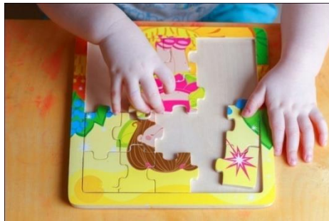
Gambar 1. Media Puzzle sebelum dikembangkan