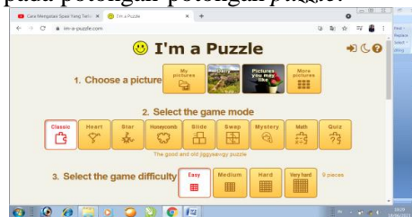
Gambar 4. Rancangan jenis Potongan – potongan Puzzle

Berdasarkan gambar 1.3 tampilan awal Media puzzle memuat tombol start dan share. Jika tombol start di klik, pemain akan diarahkan pada potongan-potongan puzzle .