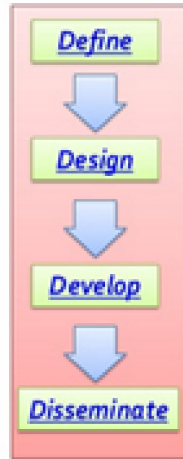
Gambar 1. Desain Penelitian Pengembangan Dengan Model 4-D Thiagarajan (1974: 6-9)

Rancangan penelitian pada tahap ini adalah Pretest-Posttest Control Group Design. Desain penelitian ini dimulai dengan melakukan tes awal (pretest) untuk mengetahui kemampuan awal mahasiswa. Selanjutnya diberikan perlakuan dalam jangka waktu tertentu. Pada akhir perkuliahan dilakukan test akhir (posttest). Sebagai uji akhir untuk mengetahui hasil belajar mahasiswa dan hanya membandingkan antara nilai pretest dan posttest mahasiswa selama perkuliahan.