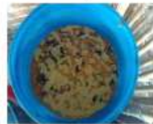
Gambar 10. Hasil fermentasi rempah rempah kedalam bejana selama 2 minggu