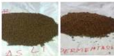
Gambar 13 Pakan lele yang asli dengan pakan lele yang sudah difermentasi