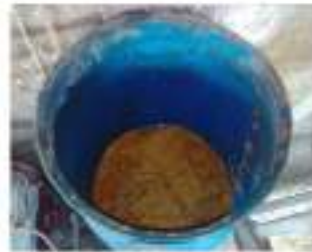
Gambar 9. Proses penyimpanan fermentasi rempah rempah kedalam bejana