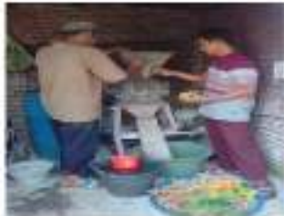
Gambar 6. Proses penggilingan bahan rempah rempah yang sudah dipotong