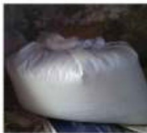
Gambar 12. Proses penyimpanan hasil fermentasi selama 15 hari

Setelah melalui proses fermentasi cairan rempah rempah dan proses mengaduk pakan lele yang sudah difermentasi samosai merata. Langkah selanjutnya adalah penyimpanan hasil fermentasi selama 15 hari kedalam karung. Setelah 1 hari proses penyimpanan fermentasi, karungnya dibuka dan siap untuk dikonsumsi ikan lele.