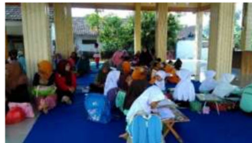
Gambar 4. Kegiatan melukis dan mewarnai oleh anak-anak

Kiat-kiat yang disampaikan tersebut memberikan kontribusi yang positif dan efektif akan keterlaksanaan kegiatan yang telah disampaikan pada sosialisasi resiko gelnet terhadap perkembangan otak anak, para ibu warga sumbernongko telah menerapkan kiat-kiat tersebut dalam kehidupan sehari-hari dengan memperhatikan penggunaan gadget pada anak. Disamping itu juga dilakukan kegiatan setiap akhir minggu yang dilaksanakan secara rutin sebagai bentuk penerapan “kegiatan hari tanpa gadget” dengan mengajak anak-anak datang ke balai desa untuk mengeksplor kreativitasnya dengan mengembangkan hobi yang mengasah keterampilan seperti melukis, mewarnai, bercerita dan lainnya.