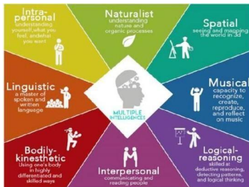
Gambar 3: Diagram MultipleIntelligences

dalam otak manusia. Berikut gambar diagram kecerdasan pendekatan Multiple Intelligences , tersebut: