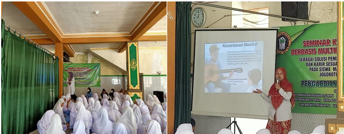
Gambar 4: Pelaksanaan Kegiatan PkM di MA Midanut Ta'lim Jogoroto Jombang

Pelatihan berupa materi dan wawancara yang dilakukan dengan penyebaran angket. Angket yang digunakan adalah angket non tes. Di mana hasilnya para siswa/i di MA Midanut Ta'lim sangat merespon positif angket yang diberikan dengan mengisi semua pertanyaan sehingga penelusuran bakat dan minat berjalan dengan baik. Materi yang diberikan adalah tentang pengertian bakat dan minat, penelusuran bakat dan minat, serta pemanfaatan bakat dan minat dalam penjurusan kuliah, atau dalam pemilihan pekerjaan dan karir. Pelatihan tersebut dilaksanakan di aula masjid MA Midanut Ta'lim Jogoroto Jombang dengan jumlah peserta 130 siswa kelas putri dan putra. Siswa sangat antusias mengikuti pelatihan dan sangat aktif karena banyak yang bertanya atau menjawab pertanyaan yang diberikan tim PkM dengan jawaban yang amat baik. Setiap siswa menemukan bahwa mereka mempunyai lebih dari satu kecerdasan. Dari hasil wawancara dengan para siswa, mereka mengatakan minimal mempunyai 2 kecerdasan pada dirinya. Untuk mempermudah pengamatan, tim membuat grafik yang dapat dilihat di bawah ini: