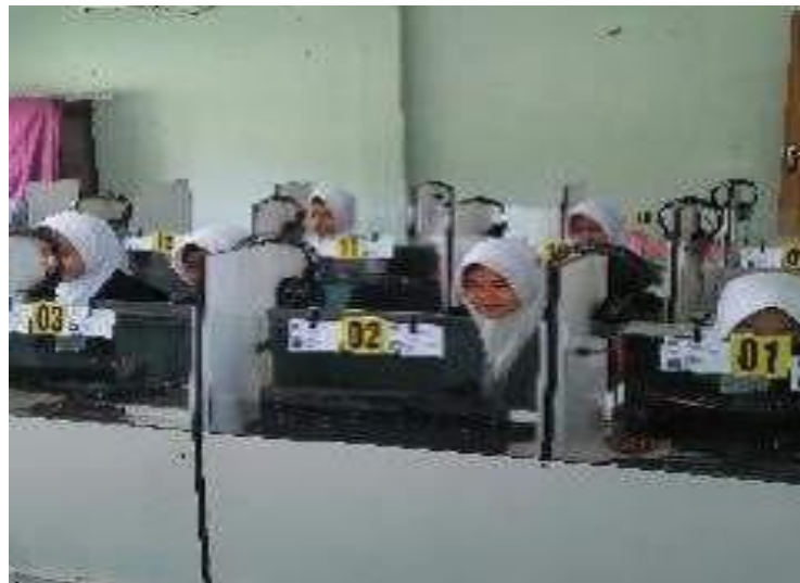
Gambar 1: Pembelajaran di MA Midanutta'lim Jogoroto Jombang

Multiple Intelligences atau biasa disebut dengan kecerdasan majemuk adalah berbagai keterampilan dan bakat yang dimiliki siswa untuk menyelesaikan berbagai persoalan dalam pembelajaran dan kehidupan. 3 Diketahui dari wawancara dengan guru BK siswa kelas 12 MA Midanutta'lim belum pernah melakukan tes pengujian bakat dan minat dengan pendekatan Multiple Intelelence . Berikut gambaran sekolah dan kegiatan kelas 12 MA Midanutta'lim Jogoroto Jombang.