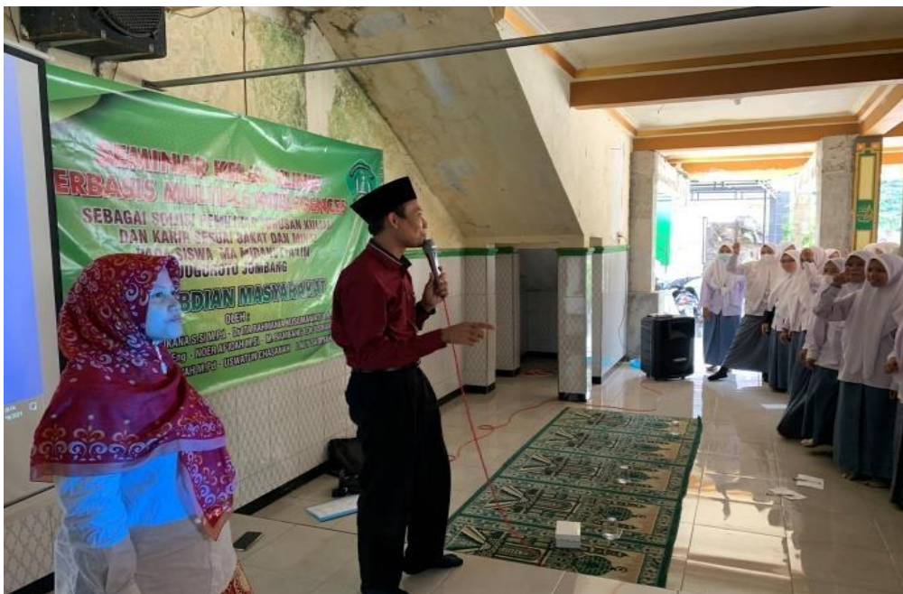
Gambar 2: Pelaksanaan pelatihan minat bakat pendekatan Multiple Intelelegences

sesuai jurusan kuliah yang akan diambil mereka setelah lulus nanti. Pelatihan dan penelusuran bakat dan minat dilakukan dengan pendekatan Multiple Intelelegences . Melalui kebiasaan-kebiasaan yang dilakukan, akan terlihat kemampuan bakat dan minat yang dipunyai siswa. Bakat dan minat sangat berhubungan dengan kecerdasan yang dimiliki, setiap siswa yang satu dengan yang lainnya sangat istimewa, karena mempunyai bakat dan minat yang berbeda-beda. Setiap siswa dapat memiliki lebih dari satu bakat dan minat atau beberapa kecerdasan.