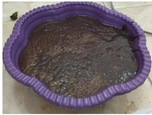
Gambar 2. Poc Berbasis Mol

kemudian disiramkan pada tanaman yang kita beri perlakuan.