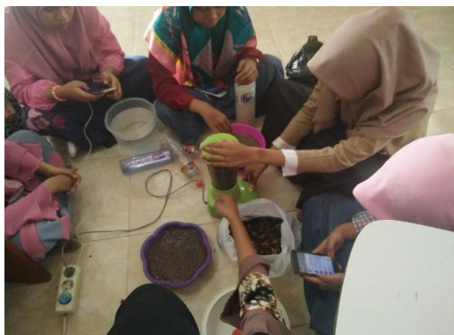
Gambar 1. Mahasiswa sedang praktik membuat POC

mengetahui pengaruh pemberian edukasi Eco-education kepada mereka.