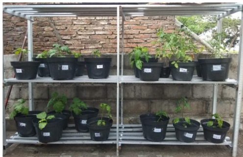
Gambar 3. Budidaya Tabulampot

Dalam pembuatan poc yang telah dilakukan dengan menggunakan bahan utama limbah sayuran, kulit buah dan air cucian beras ini setelah dua minggu menghasilkan pupuk cair yang beraroma seperti tape. Hal ini menunjukkan bahwa mikroorganisme telah bekerja dengan baik selama proses fermentasi. Penggunaan EM4