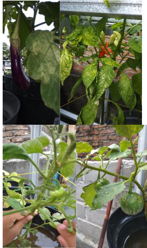
Gambar 4. Hasil Budidaya Tabulampot Dengan Memanfaatkan Poc

sebagai bahan tambahan pemicu munculnya mikroorganisme pada pupuk cair yang kita buat. Poc yang telah dibuat selanjutnya diaplikasikan pada tanaman yang kita budidayakan dengan metode tabulampot.