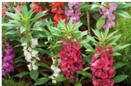
Gambar 1. Tanaman bunga pacar air

Salah satu tanaman yang memiliki warna bunga mencolok adalah tanaman pacar air ( Impatiens balsamina ). Bunga tanaman pacar air dapat berwarna merah, ungu, pink, orange, dan putih. Tanaman pacar air merupakan salah satu potensi lokal kabupaten Jombang, sebab banyak dibudidayakan di kecamatan Peterongan (Trirahardjo, 2020) dan kecamatan Sumobito (Bhirawa, 2019). Pemanfaatan tanaman pacar air selama ini hanya sebatas pada bunga saja untuk diperjual belikan.