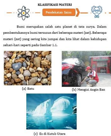
Gambar 1.1 Macam-Macam Materi (Zat)