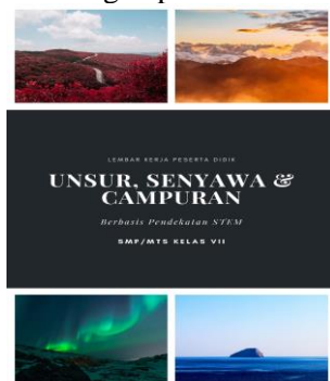
Gambar 1. Cuplikan Cover LKPD

Gambar 1 dan Gambar 2 berikut ini merupakan cuplikan LKPD unsur, senyawa, dan campuran dengan pendekatan STEM.