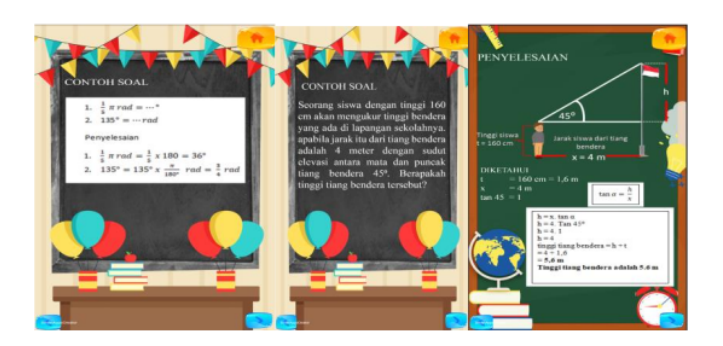
Gambar 4. Contoh soal

Pada tampilan akhir ini berisi latihan soal untuk siswa. Setiap jawaban yang benar maka skor akan bertambar 10 poin dan jika salah maka skor akan bertambar 0. Di akhir media ini akan ditampilkan hasil skor total yang diperolah siswa. Tampilan dapat dilihat pada gambar berikut.