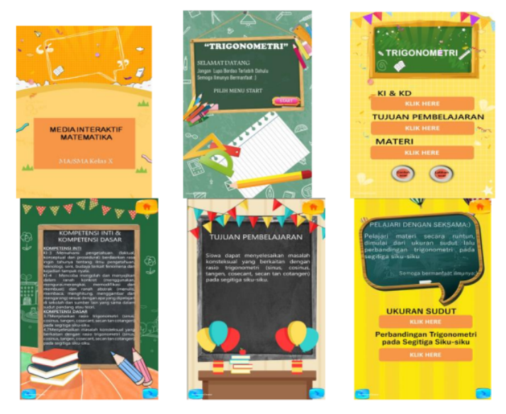
Gambar 1. Tampilan awal media

Dalam media pembelajaran ini terdapat beberapa tampilan media yaitu tampilan awal media, tampilan isi media dan tampilan akhir media. Pada tampilan awal media terdiri dari halamanan startpage, halaman judul media, halaman menu, halaman KI dan KD, halaman tujuan pembelajaran dan halaman menu materi. Tampilan awal media dapat dilihat pada gambar berikut.