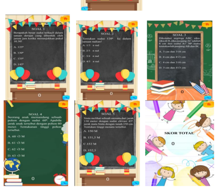
Gambar 5. Latihan soal dan skor total

Pada tampilan akhir ini berisi latihan soal untuk siswa. Setiap jawaban yang benar maka skor akan bertambar 10 poin dan jika salah maka skor akan bertambar 0. Di akhir media ini akan ditampilkan hasil skor total yang diperolah siswa. Tampilan dapat dilihat pada gambar berikut.