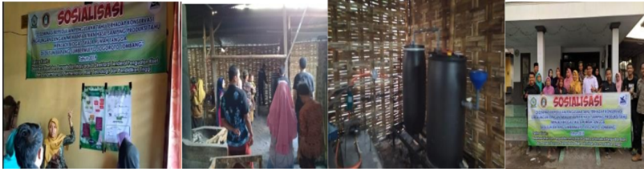
Gambar 1. Kegiatan sosialisasi

acara selesai para peserta diberikan angket lagi terkait respon yang mereka peroleh setelah sosialisasi. Berikut adalah kegiatan sosialisasi yang dilakukan.