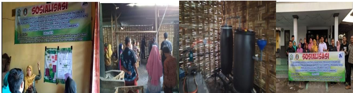
Gambar 1. Kegiatan sosialisasi

acara selesai para peserta diberikan angket lagi terkait respon yang mereka peroleh setelah sosialisasi. Berikut adalah kegiatan sosialisasi yang dilakukan.